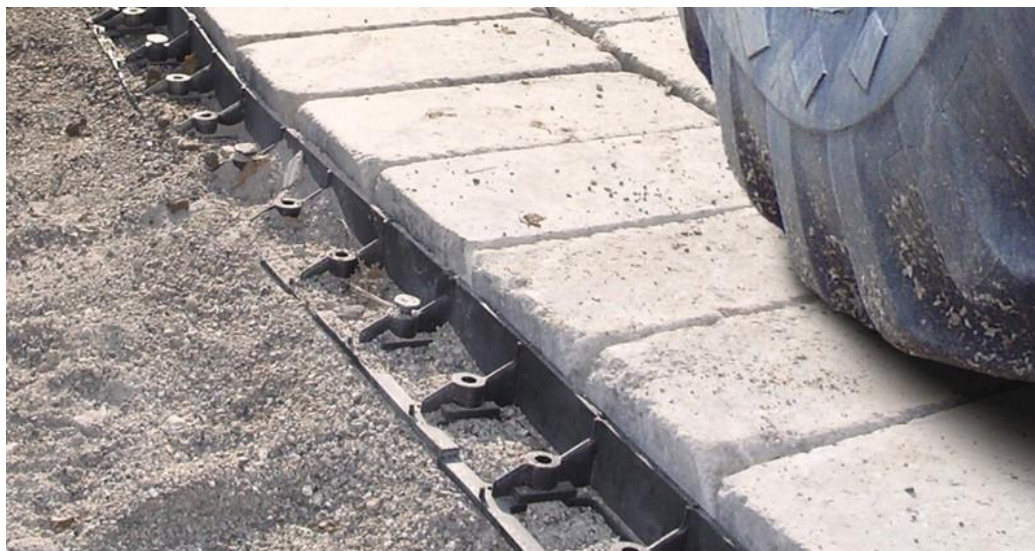
写真2 プラスチック製の端部拘束材(その2)