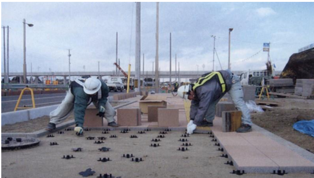
写真5 プラスチック製スペーサー現場施工状況