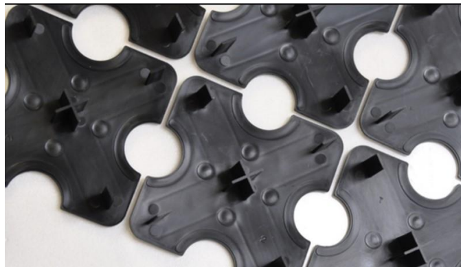
写真4 プラスチック製スペーサー(その2)