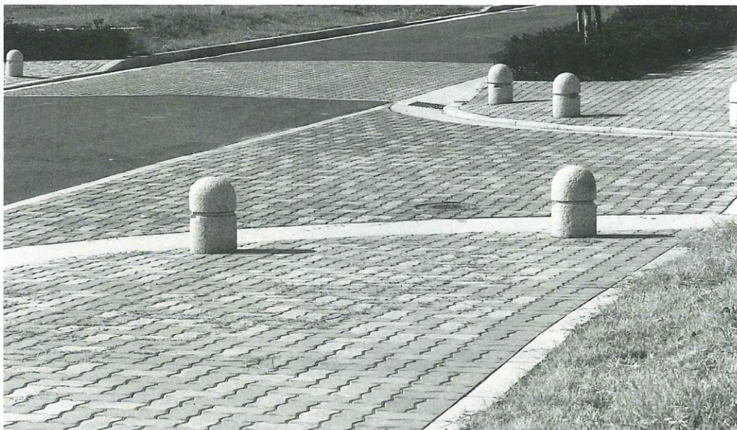
▲きれいに清掃の終わった施工現場。