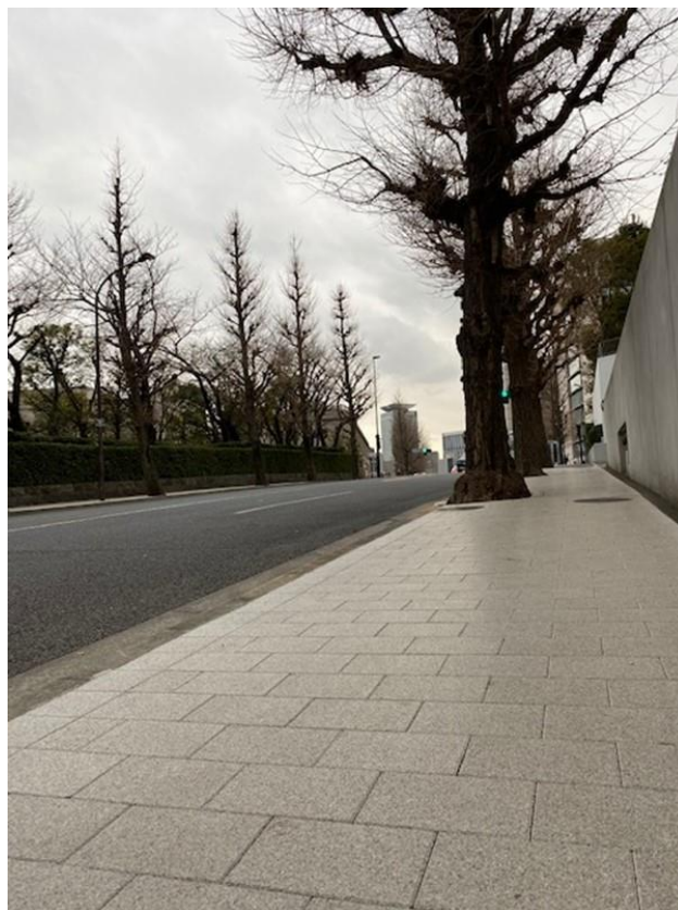
国会図書館前歩道(永田町一丁目)