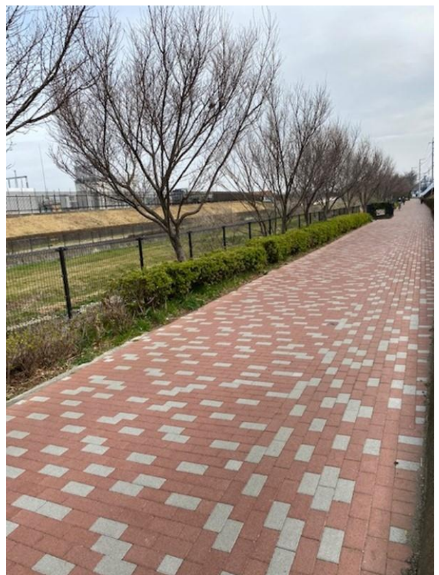
空堀川整備工事(東村山市)