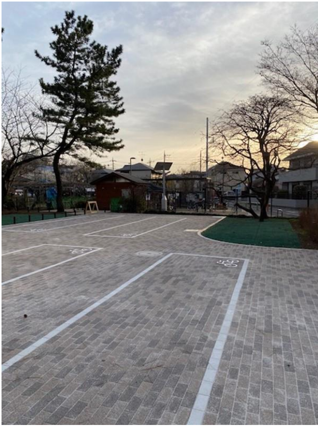
練馬区立こどもの森公園